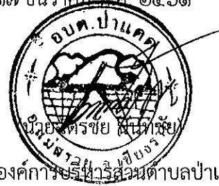
นายกองดีการะพันธ์

หมายเหตุ ผู้ประกอบการสามารถจัดเตรียมเอกสารประกอบการเสนอราคา (เอกสารส่วนที่ ๑ และเอกสารส่วนที่ ๒) ในระบบ e-GP ได้ตั้งแต่วันที่ซื้อเอกสารจนถึงวันเสนอราคา